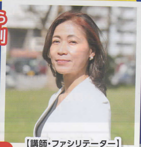
【講師・ファシリテーター】